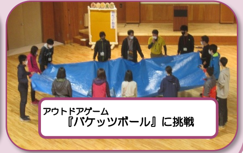
アウトドアゲーム 『バケッツボール』に挑戦