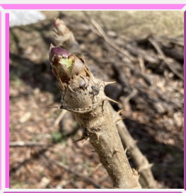
タラの芽とタラの木