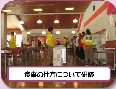
食事の仕方について研修

自然の教室（夏季）を前期実施予定校の担当教員を対象に、現地研修会を行いました。参加した先生方からは「実際に活動することで、児童への指導時に配慮すべきことが見えてきました。」「親切、丁寧に教えていただき、安心して取り組みました。」等の言葉をいただきました。