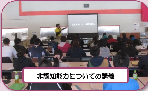
非認知能力についての講義