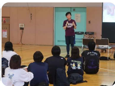
教育長アクティビティ