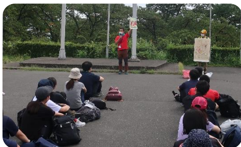
オリエンテーリング

8月22日(月)から2泊3日で、国立赤城青少年交流の家にて初任者宿泊研修が行われました。館岩少年自然の家の指導主事も研修指導者として参加しました。研修の目的は、校外学習を引率する上での指導事項の理解、他者と協働し、チームで課題に対応する力を高めること、そして、With コロナの下、質の高い教育活動を工夫しながら実施する視点と姿勢を養うことです。オリエンテーリング、教育長アクティビティや赤城山登山を通して、教員としての視点と参加者として子どもたちの視点とをもちながら研修に取り組んでいる初任者の姿が見られました。