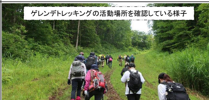
グレントレッキングの活動場所を確認している様子