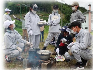
野外炊飯 浦和中学校