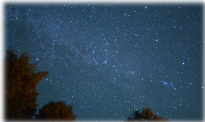
たかつえの星空観察

南会津は大都市から離れていて、標高が高く空気が澄んでいるので、夜のとばりが下りた後、満天の星々に包まれます。このよさを生かした活動プログラムに「星空観察」があります。子どもたちは所員による星空解説を聞いたり、4年生で学習した星座を観察したりし、夜空のもつ魅力を存分に味わうことができるプログラムとなっています。 ※たかつえ・南郷どちらでも実施できるプログラムです。