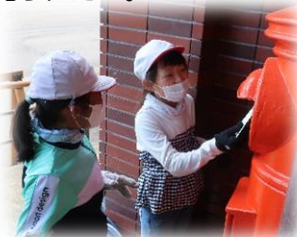
家族へ手紙 大宮東小学校