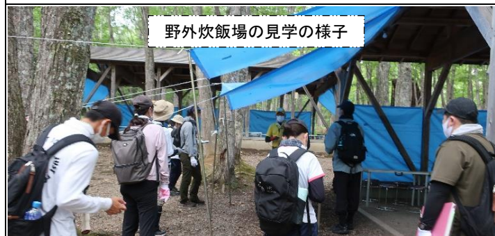
野外炊飯場の見学の様子