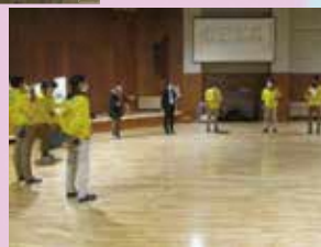
火災・災害時対応研修 食舎・施設管理業者と共同で、有事の際の対応、利用団体の誘導の研修を実施し、より安全で迅速な対応について検討しました。