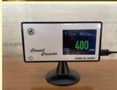
食堂内 一酸化炭素濃度計設置