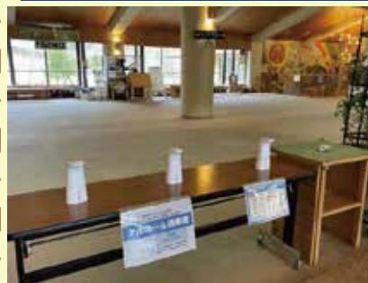
エントランス入口 手指消毒用アيسペンサー設置

自然の家では感染防止のため、様々な対策を講じております。そこで、その一部をご紹介します。