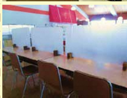
食堂内テーブル パーティション設置（消毒の徹底）