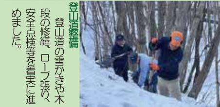
登山道整備 登山道の雪かきや木段の修繕、ロープ張りの安全点検等を着実に進めました。