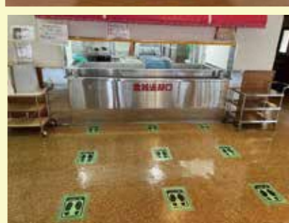
食堂食器回収口前 返却方法を改善した感染防止対策