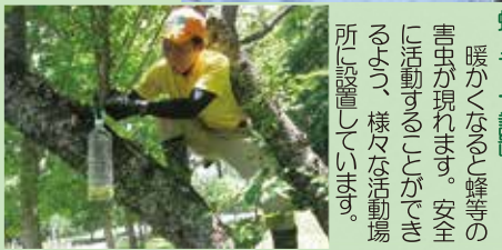
蜂トラップ設置 暖かくなると蜂等の害虫が現れます。安全に活動することができるよう、様々な活動場所に設置しています。