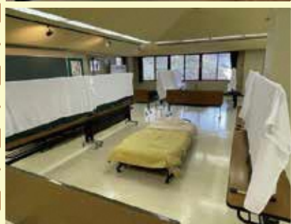
第2研修室 「健康観察室」として使用