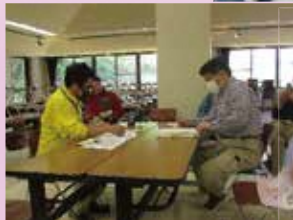
プログラム相談研修 プログラム相談の際に注意すべきことや、スムーズな進め方について研修しました。