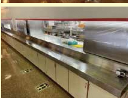
食堂配膳カウンター 飛沫感染防止シート設置