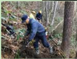
下山道工事 下山道が自然災害等で利用できない時のために、迂回することができるよう道づくりをしました。