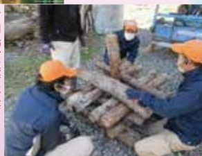
活動場所準備研修 キャンプファイヤーの井桁の組み方等、各活動の場の設定や、活動準備について研修しました。