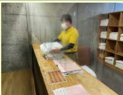
リネン室カウンター 飛沫感染防止シート設置