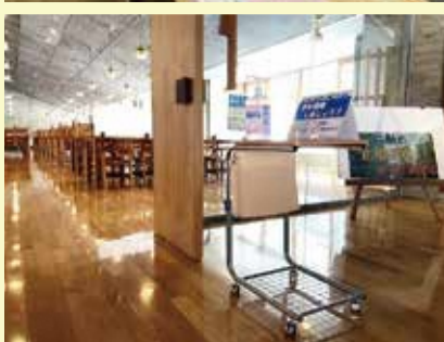
食堂入口 手指消毒用アيسペンサー設置