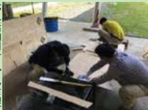
野外活動用テーブル作製 野外炊飯や野外軽食等、野外での作業時に使用することができる簡易テーブルを作製しました。

「自然の教室」の実施に向け、登山道や活動場所の整備を計画的に進めてきました。安心安全な「自然の教室」が実施できるよう、今後も敷地内の点検・整備を確実に行っていきます。